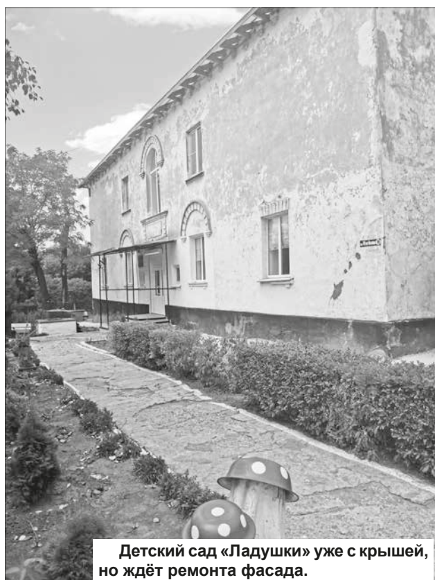
Детский сад «Ладушки» уже с крышей, но ждёт ремонта фасада.