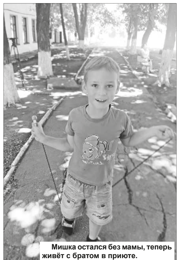
Мишка остался без мамы, теперь живёт с братом в приюте.