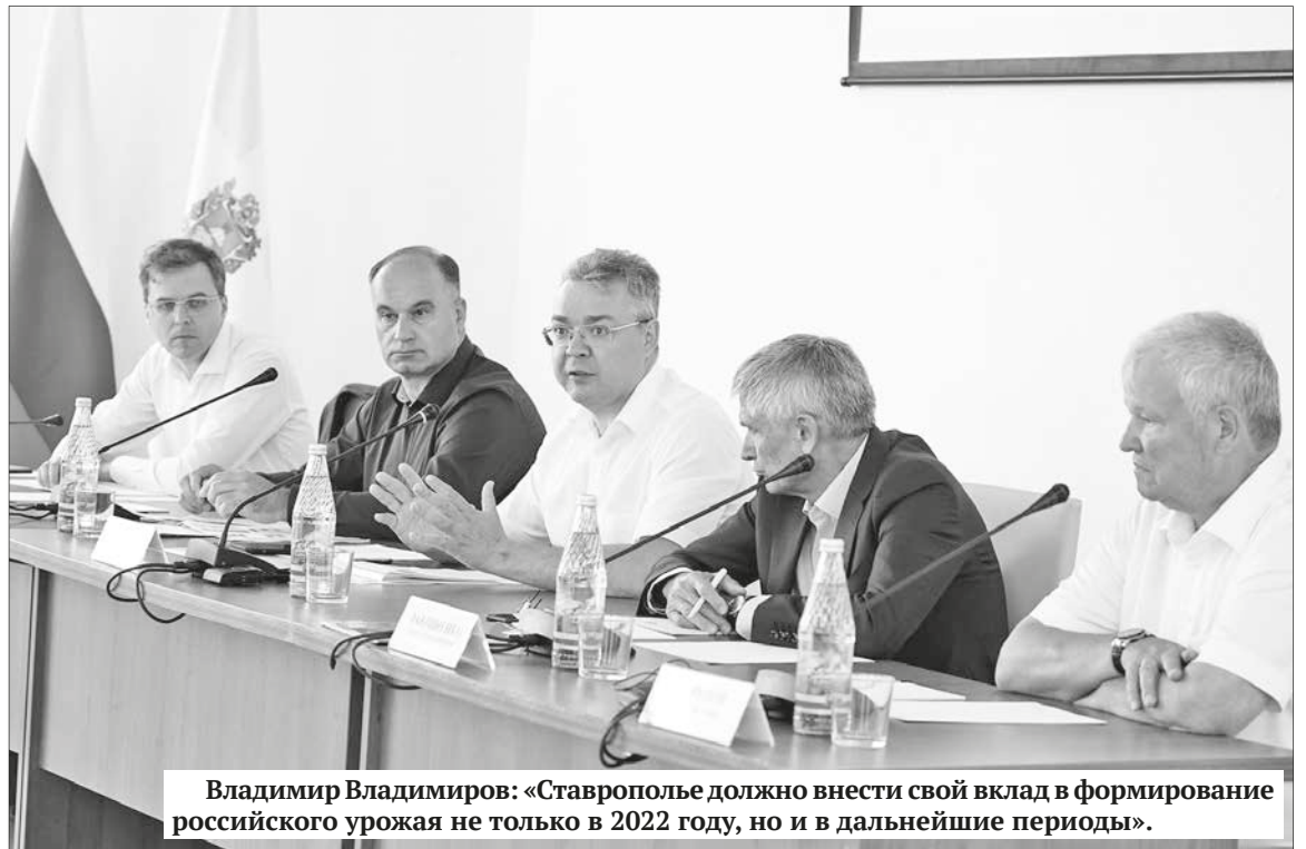
Владимир Владимиров: «Ставрополье должно внести свой вклад в формирование российского урожая не только в 2022 году, но и в дальнейшие периоды».

Отдельно губернатор заострил внимание на задачах противопожарной профилактики на полях. Он подчеркнул, что этот вопрос является не только экономическим, с ним связана безопас-