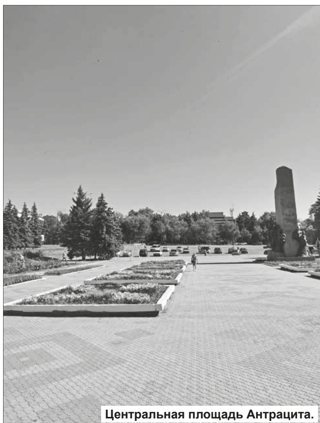
Центральная площадь Антрацита.

противостояния сегодня далеко от Антрацита и сейчас здесь сильный запрос на восстановление мирной жизни.